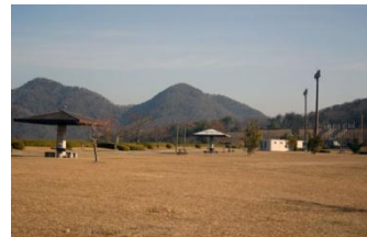
ファミリー広場(凧揚げ会場)