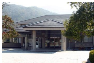
公園管理センター