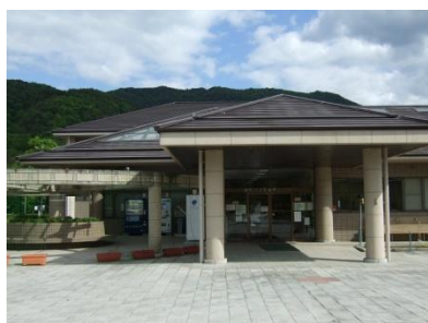
公園管理センター