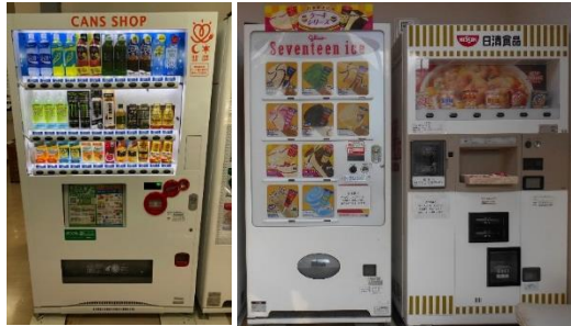
管理センター 内部