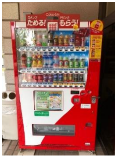
管理センター 外部