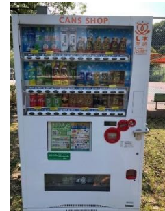
テニスコート 下段