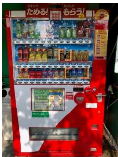
テニスコート 中段