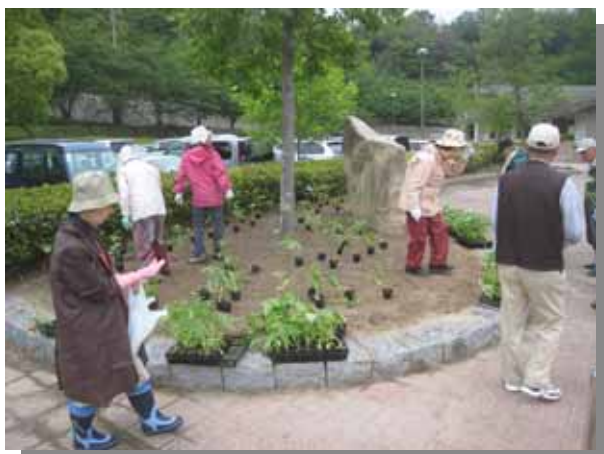
まずは花の会の皆様に準備をしていただきました。