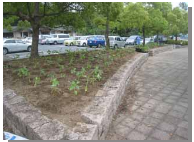
今年の苗は大きく、ボリュームがあります。