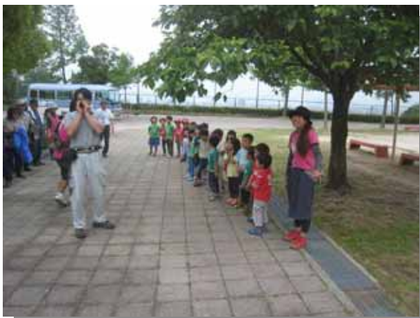
みんな大きな声でおまじない！「おおきなあ〜れ！」。これでヒマワリも無事育つでしょう。