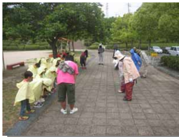
最初のごあいさつ、「みなさん、おはようございます。」