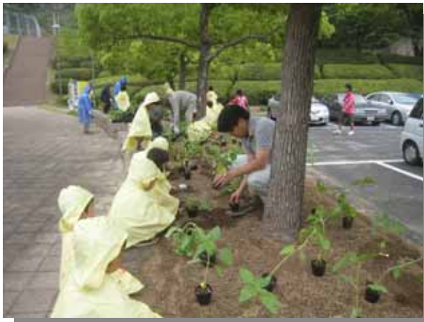
みんなで楽しく作業開始！