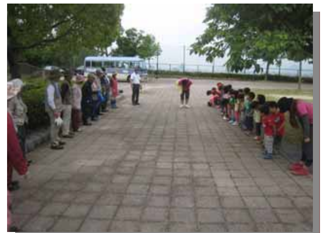
皆様、「ありがとうございました！」