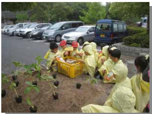
道具を各自で取りに行きます。