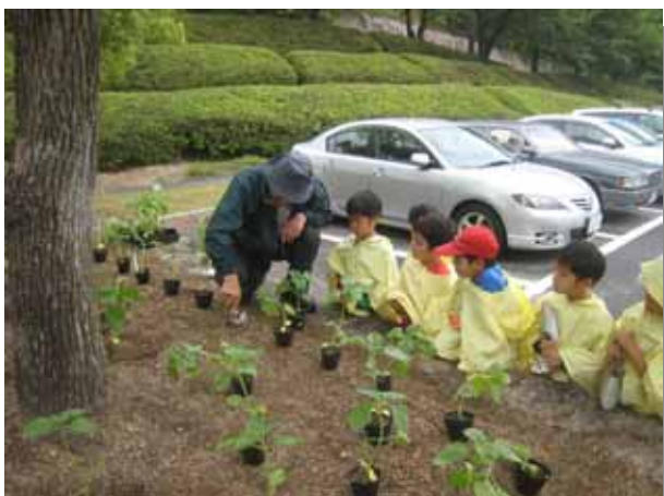
苗の植え付け作業の説明「こうやって土を掘るんだよ。」