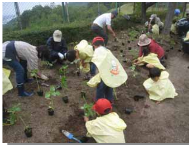
苗が大きく数も多かったので結構、作業が大変でした。