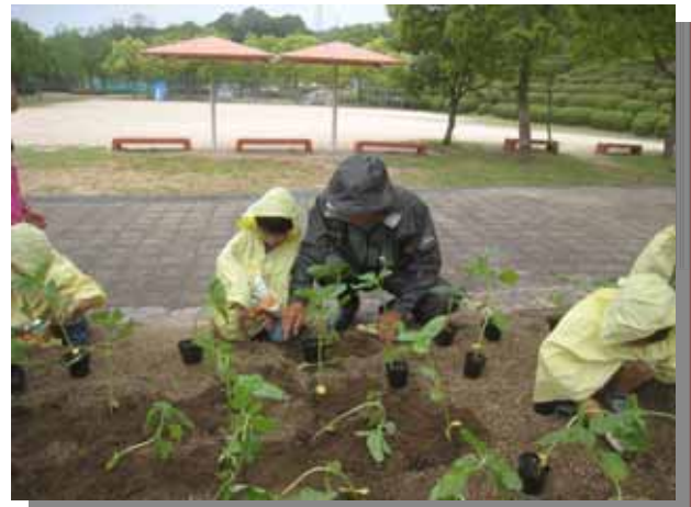
あいにくの雨でかっぱを着て作業です。でも後半には雨が止みました。