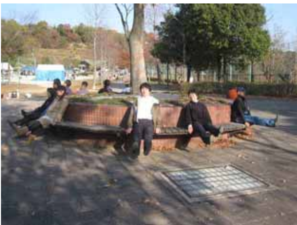
ベンチをつかってストレッチ。これぞまさにパークエクササイズ！