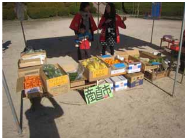
新鮮な野菜や果物の並んだ産直市。