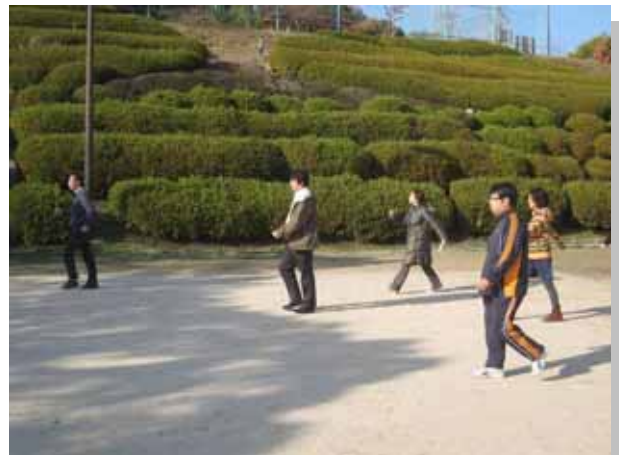
正しい姿勢と効果的な歩行ペースを確認しました。