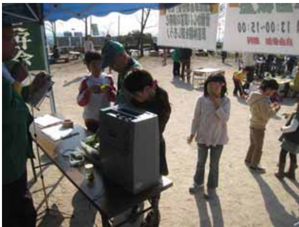
「草笛って楽しいね！」