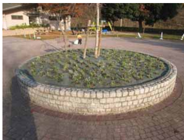
無事、作業完了。開花が待ち遠しいです。どうもありがとうございました。