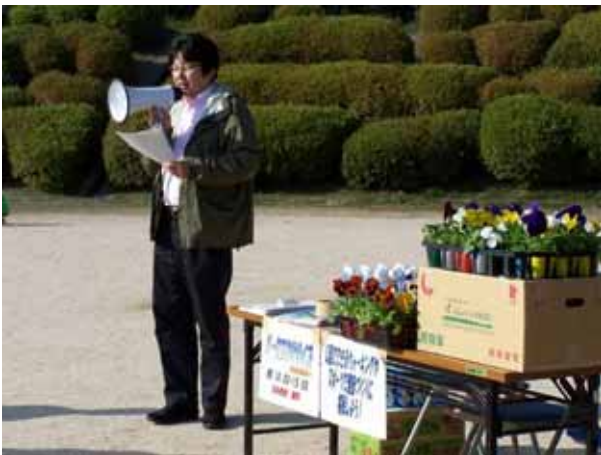
吉長先生による基調講演「パークエクササイズで健康になりましょう！」

皆さん、日頃の健康管理に役立つ知識なども教わり、秋空のもとで気持ちよく実践されていました。