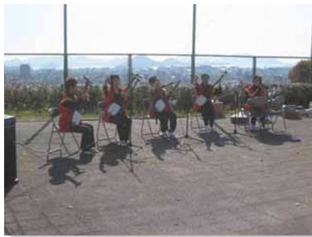
太鼓も交えてこの迫力！