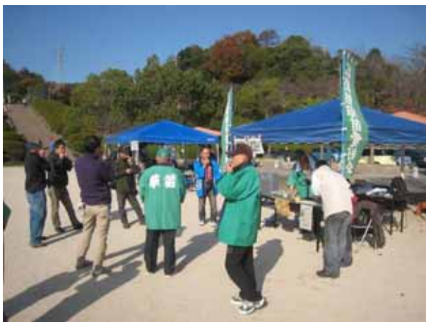
草笛の音に導かれ、続々と人が集まってきました。

草笛はとても手軽に楽しめ、魅力あるものであることを参加者の皆さんは感じたと思います。