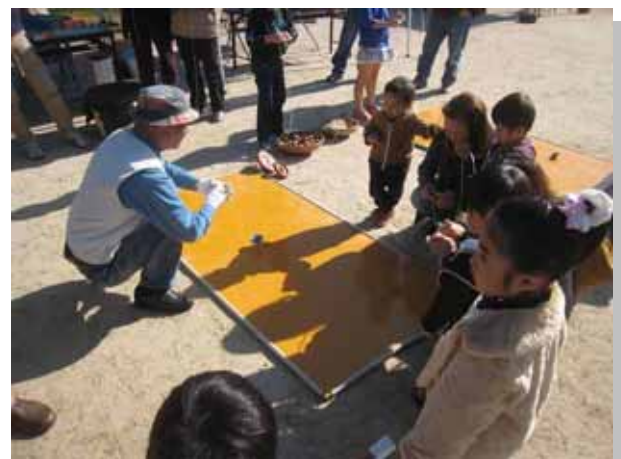
おかあさんも一緒に注目、「こうやって回すんだよ！」