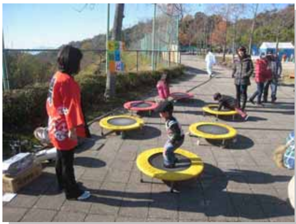
子ども達は楽しそうにピョンピョン。

トランポリンを使った健康運動で、音楽に乗って飛び跳ねます。残念ながら先生以外の大人の参加はありませんでしたが、子どもたちは楽しそうに飛び跳ねていました。