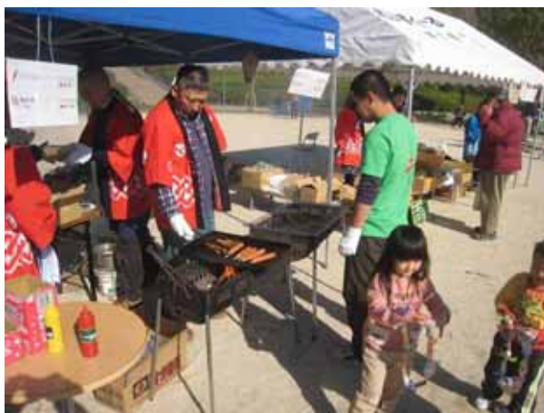
フランクフルトと焼き鳥、焼けてるよ～！