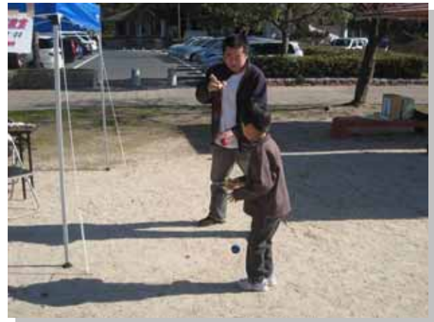
親子共々「なかなか難しいね～」