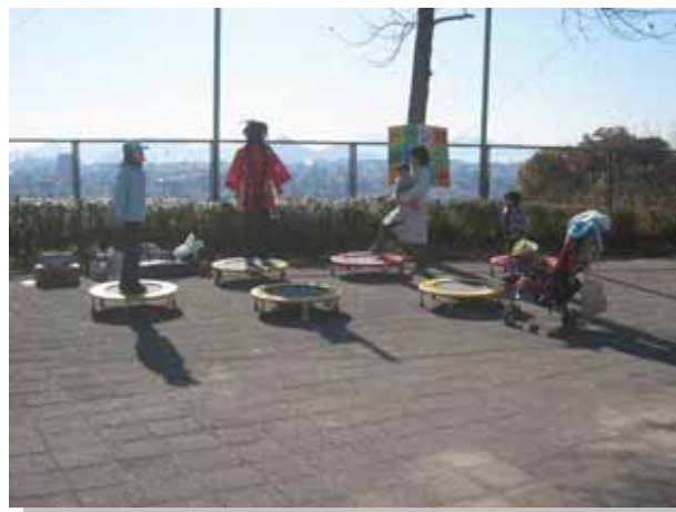
先生も一緒に「こうやって跳ぶんだよ！」