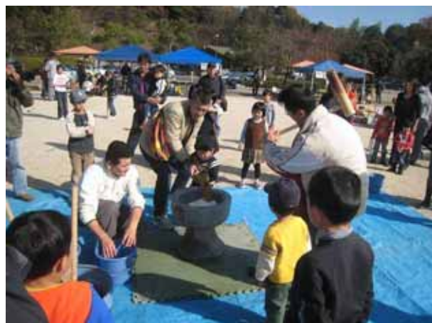
お父さんと一緒にヨイショ！ おいしいお餅をつくるぞ～