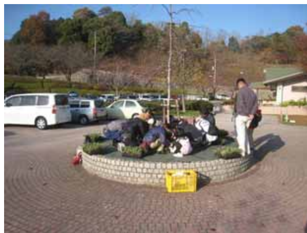
苗を踏まないように中心側から苗植えスタート。