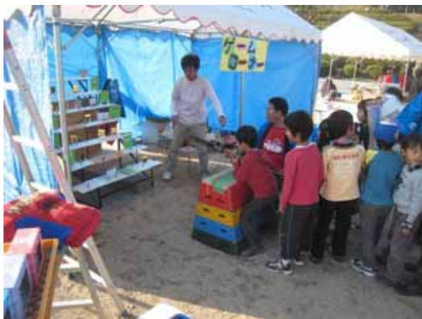
射的は大人気でいつも列ができていました。

これら縁日・屋台の収益金は、ぶれいすく - る・ちゅーりっぷの方々によりWFPへ寄付を行いました。