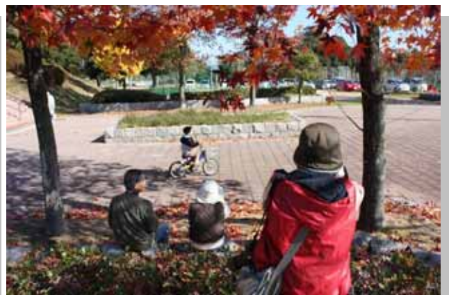
自転車の練習風景を撮影。広角レンズで紅葉をとりこんで...。「ぼく～！もう1周回ってきて～！」