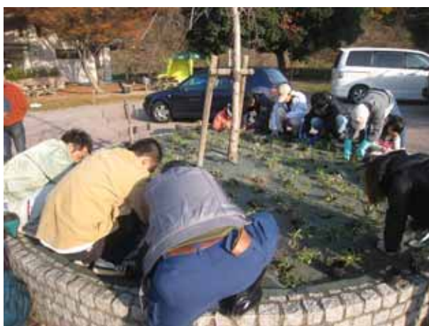
ついに外側まで到達。作業はあともう少し