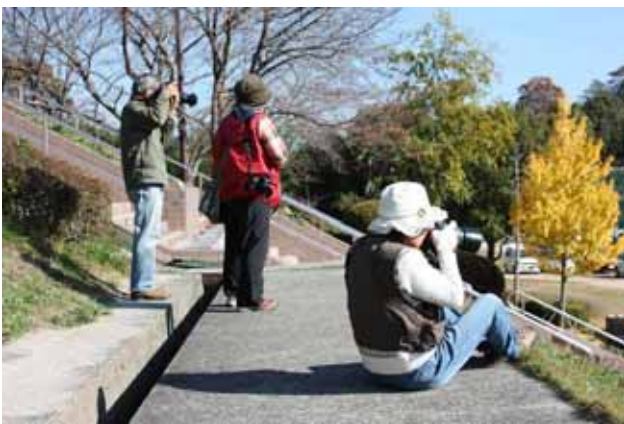
「ここからの風景、おもしろいかも！」

最後は撮影した写真をパソコンで見ながら先生に解説していただきました。「さあ、竜王公園四季の写真コンテストに応募して賞金ゲットして新しいレンズ買うぞ～！」どしどしご応募を！！