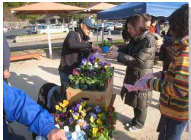
参加者には障がい者施設の皆さんが育てた花苗をプレゼントしました。