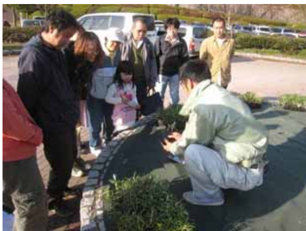
「花苗はこうやって植えます」とレクチャーを受ける参加者の皆さんの表情は真剣そのもの

自分の身近な環境への花の植え付けに参加することは、「自分の植えた花はちゃんと育って、咲いているだろうか?」「その花を見て他の人は喜んでくれているかな?」など、その場所への愛着を生み、もっといい環境に、もっと美しい場所にしていきたいという気持ちにさせてくれます。