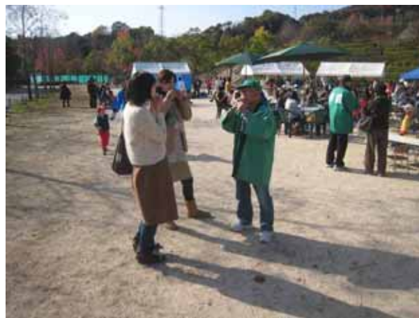
「お母さん方、こうやって音を出すのですよ。」