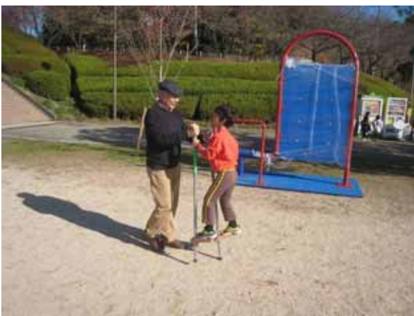
「イッチ、ニ イッチ、ニ」