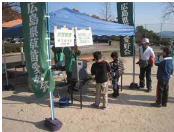
子どもたちも草笛にチャレンジ！ 音は出たかな？