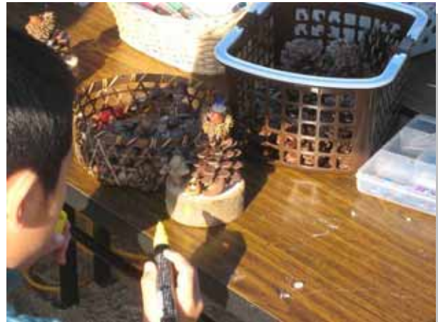
ドングリやマツボックリを使って、何ができあがるのかな？