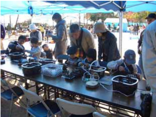
作業をする子どもたちの表情は真剣そのもの。

参加した子どもたちはドングリやマツボックリなどを利用して、置き物などを作っていました。作業中の子どもたちの表情は真剣そのもので、これだけの自然素材を一同に集めて作業をする機会はあまりないので、貴重な体験になったと思います。