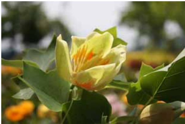
“樹上のチューリップ”と呼ばれるユリノキの花。背景をぼかして花を印象的に。