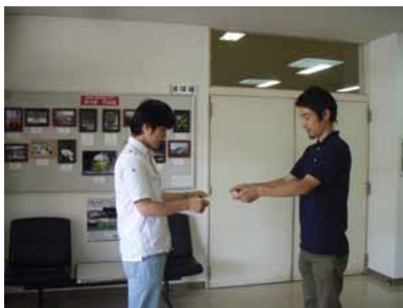
表彰式。「おめでとうございます！」

各季節でコンテストを区切り、作品展示をすることで、次回（夏、秋、冬の部）のコンテストへの広報としても有効に機能するものと思われ、参加者の増加が期待されます。