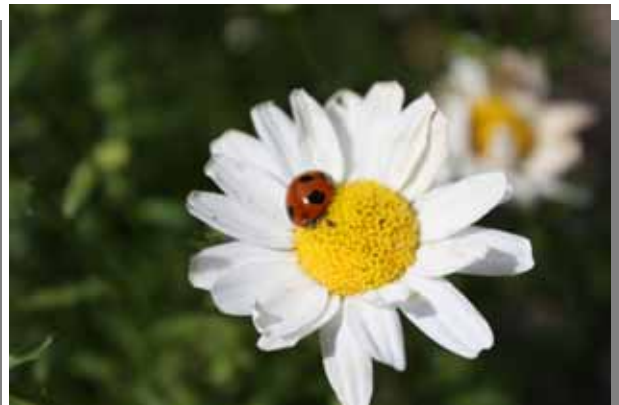
ノースポールとテントウ虫。「テントウ虫の顔が見えるともっとよい」とアドバイスをいただきました。確かに～。