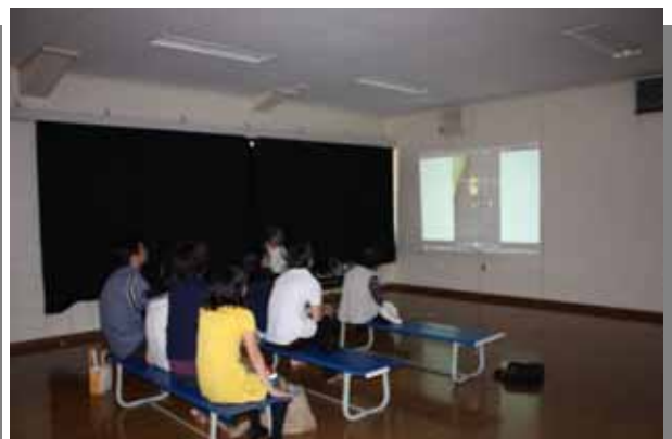
参加者1人1人、今日撮った写真をスライドに映しながらアドバイスを受ける。半日で密度の濃い講習となりました。