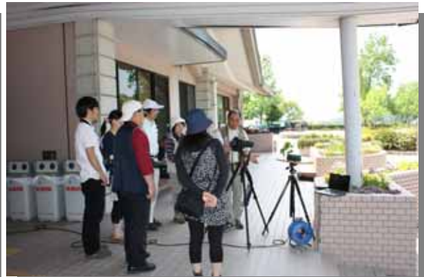
背景のつくり方、しぼりの設定など、先生の写真をパソコンモニターで見ながら学習。