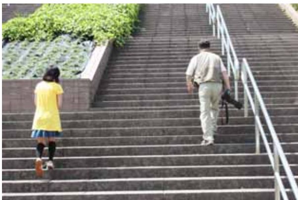
階段は、物語性のある絵になる写真スポットによく使われるそうです。「絵になる構図を見つけると、あとはタイミングをじっと待つ」