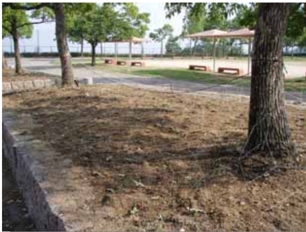
鳥がヒマワリの若葉を食べてしまうので、鳥よけのネットを設置。