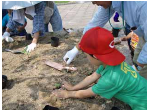
苗のまわりの土をしっかりと抑えて、植え付け完了！