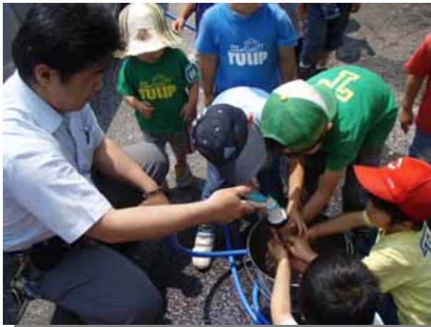
植え付け終わったら手を洗おう！バケツの水が冷たくて気持ちいい～！