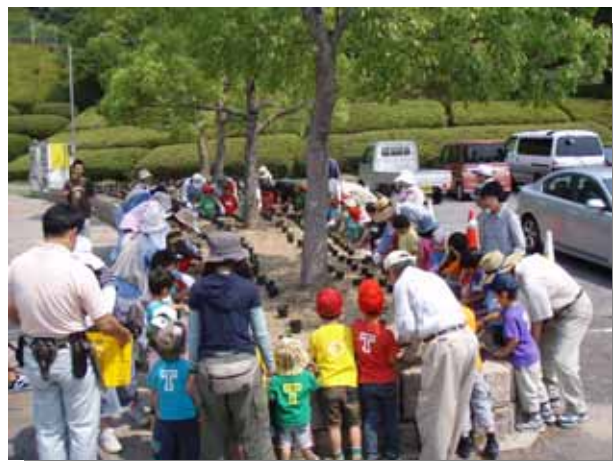
「花の会」の方々に児童さんの補助をしていただきながら、みんなで植え付けスタート。