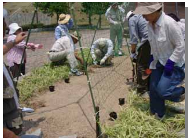
支柱にネットをつけて、アサガオを植え付け。「花の会」の皆様、どうもありがとうございました！絵になる風景ができますように...