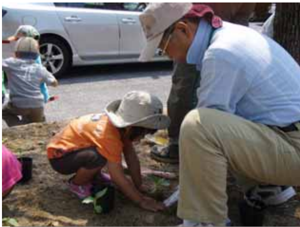
子どもも大人も、真剣に植え付けます。