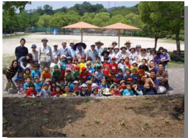
植え付けに協力いただいた「ぶれいすくーる・ちゅーりっぷ」の児童さん、「花の会」の方々に記念写真。