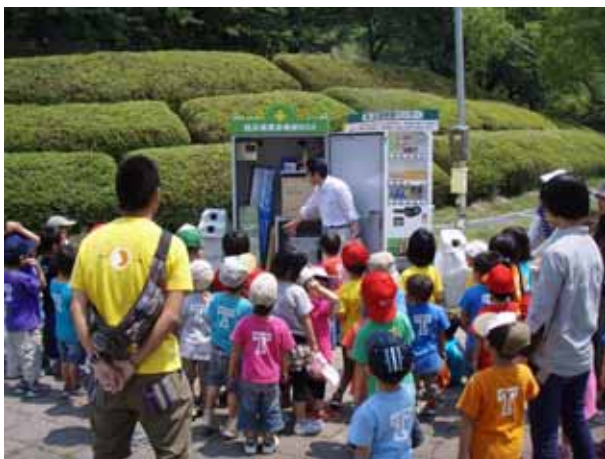
「この箱は何？」という子どもの疑問に答えて、「ボービくん」の説明。「災害の時に無料で飲料を提供して、防災道具も自由に使えるんよ。非常用トイレにもなるんよ。」