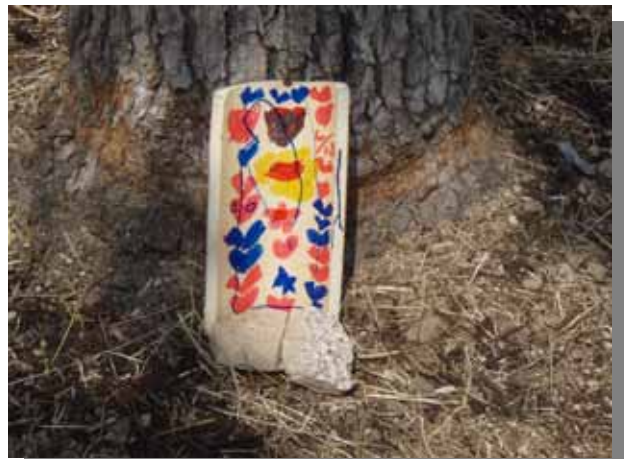
子どもたちが、植え付け記念の札をつくって置いていってくれました。