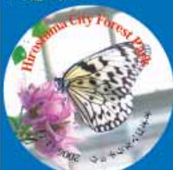
オオゴマダラチョウ